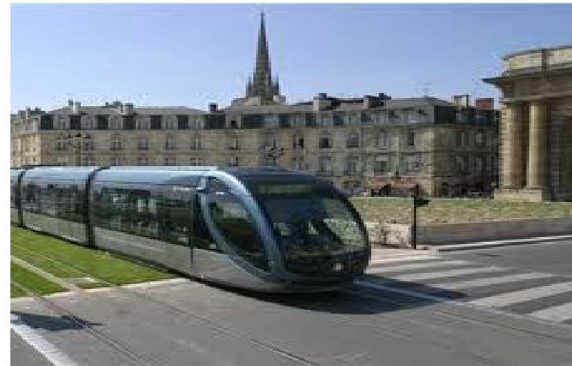
Un tramway du XXI e siècle.